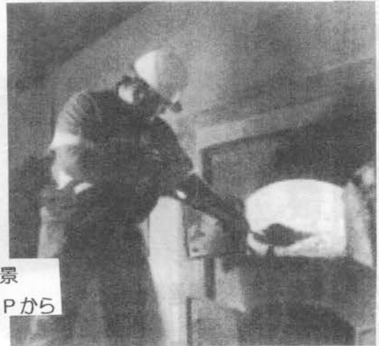
余市蒸溜所風景

しかし一方、英国からすれば、核戦力の保有を維持できなくなる恐れがある。つまり前述のクライド海軍基地のほかに英国内には移転に適した場所がほとんどない。移転させようにも核兵器貯蔵施設も含めた移転費用がかさみ、反対